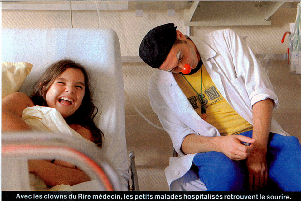
Avec les clowns du Rire médecin, les petits malades hospitalisés retrouvent le sourire.

Qu'elles soient connues ou non, elles ont besoin de nous pour mener à bien leurs actions.